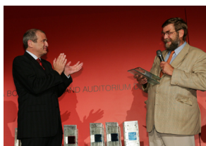
Remise du Prix de la Jeune Entreprise High-Tech de l'année

de types de documents connus et répondant à des besoins connus et spécifiques. Aucun moteur, pas même Google, ne peut prétendre être un expert dans tous les domaines !